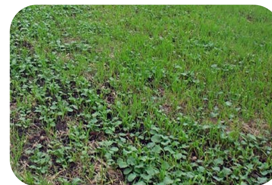
Падалиця озимої пшениці у посіві озимого ріпаку