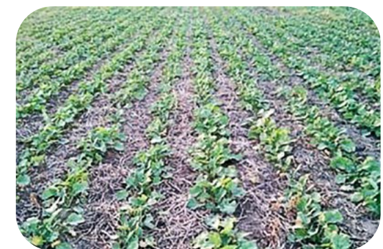
Контроль падалиці озимої пшениці